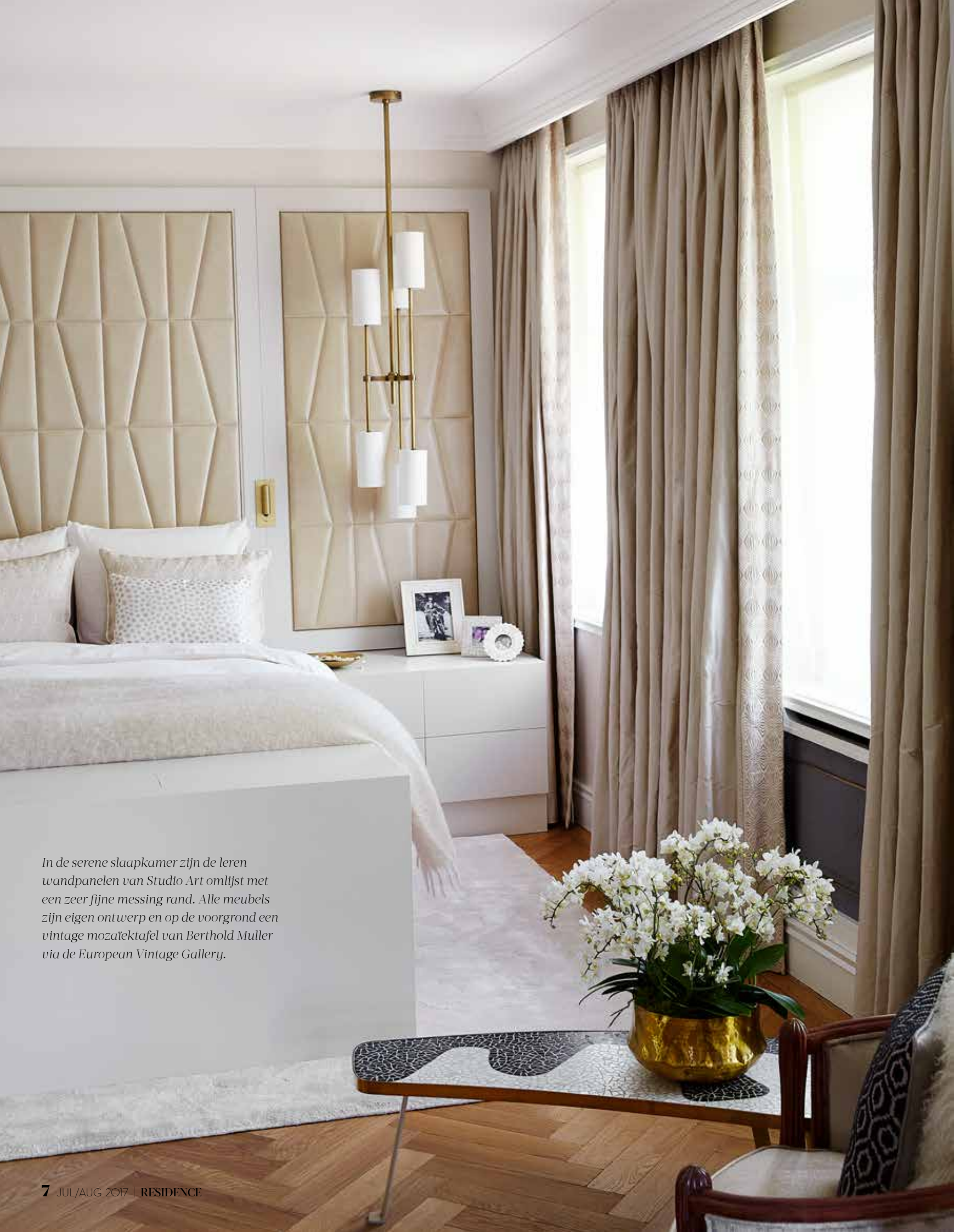
In de serene slaapkamer zijn de leren wandpanelen van Studio Art omlijst met een zeer fijne messing rand. Alle meubels zijn eigen ontwerp en op de voorgrond een vintage mozaïektafel van Berthold Muller via de European Vintage Gallery.

Op de achtergrond in de kleedkamer zijn dezelfde leerpanelen gebruikt als in de slaapkamer. De vintage kaptafel met spiegel is uit de jaren vijftig en het krukje is bekleed met stof van Dedar, beide via de European Vintage Gallery. Onder: De kleurrijke sculptuur van kunstenaarsduo Heringa / Van Kalsbeek vormt een mooi contrast met de serene tinten van het marmer in de hal en het gastentoilet. Op de achtergrond vintage lampjes van een antiekmarkt. De ronde spiegel is een eigen ontwerp van Pardovitch. De kranen zijn van THG Paris, accessoires via Baden Baden Interior en het wastafel meubel met gehamerd antiek messing bakje is ook zelf ontworpen.