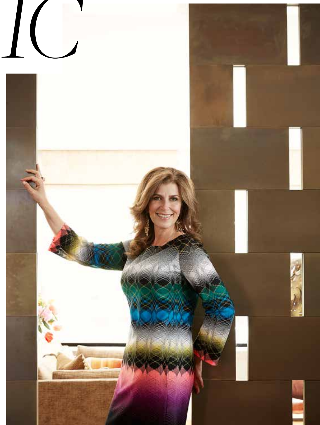
Tekst Ellen Leijser Haarstyling Eli Ichie Make up Clayton Leslie House of Orange